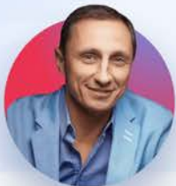
Вадим Галыгин Резидент Comedy Club