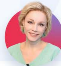
Марина Зудина Актриса театра и кино