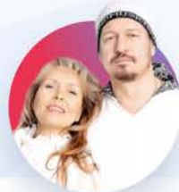
Ольга Кормухина и Алексей Белов Заслуженная артистка России, лидер группы «Парк Горького»